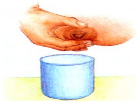
圖四：拇指放於上乳房，食指放於下乳房，其他手指支托乳房，以大拇指及食指壓乳頭後方的乳暈。