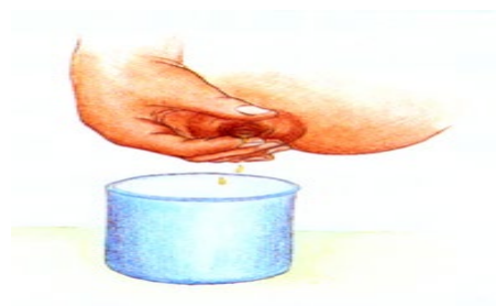
圖五：大拇指及食指放在乳暈外圍上，往胸壁方向內壓。