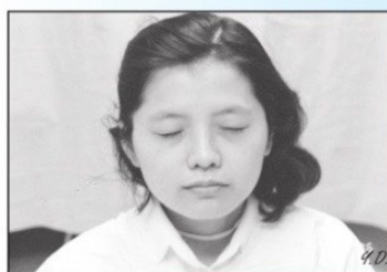
D.輕輕地將眼睛閉上，休息 5 分鐘。