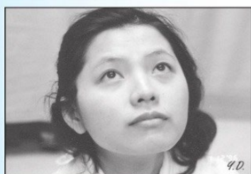
A.頭稍後仰，眼睛張開並往上看。