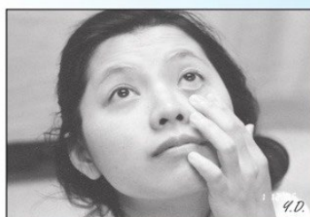
B.眼瞼往下拉並抵住顴骨。