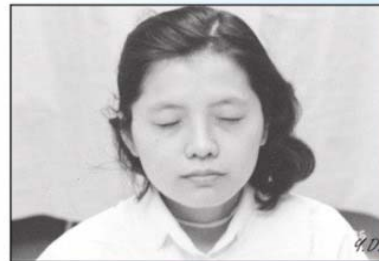
D.輕輕地將眼睛閉上，休息5分鐘。