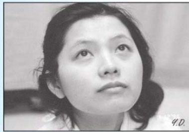
A.頭稍後仰，眼睛張開並往上看。

②點眼藥膏：請個案向上看，再以乾棉棒輕壓下眼瞼，沿著外翻的眼瞼自眼內眥（近鼻部）向外輕輕擠壓藥膏。